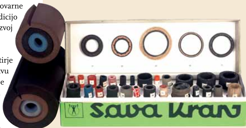
Vzorci gumenih in izolacijskih cevi, ki so jih v Savi izdelovali v prvi polovici osemdesetih let.