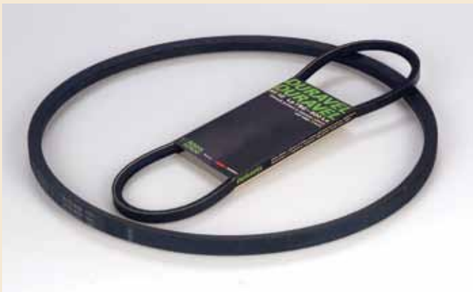
Plašč za kolo in moped ter klinasti jermeni, značilni izdelki Save, začetek osemdesetih let 20. stoletja