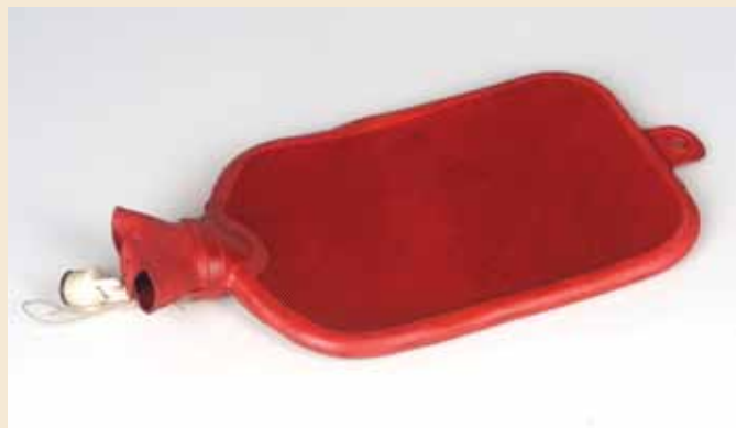
Termoform je bil eden prvih izdelkov Save. Začeli so jih izdelovati leta 1928, prav tako zračnice za kolesa in različne cevi.

Z vsesplošno motorizacijo v šestdesetih letih se je bistveno povečal obseg proizvodnje avtomobilskih pnevmatik. Leta 1967 so začeli sodelovati s tujim partnerjem, podjetjem Semperit, najprej z licenčno proizvodnjo diagonalne pnevmatike. Za proizvodnjo nove radialne pnevmatike je bila leta 1972 ustanovljena Tovarna avtopnevmatike