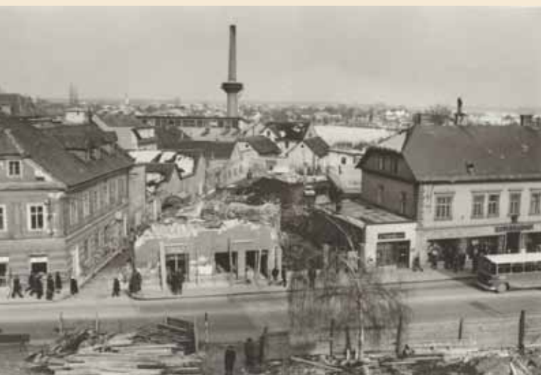
Rušenje stavb ob Koroški cesti leta 1969, pred začetkom gradnje veleblagovnice Globus. V ozadju tovarniško poslopje Save na prvotni lokaciji. Fotografska dokumentacija sodobnosti predstavlja znaten del gradiva muzejske fototeke.