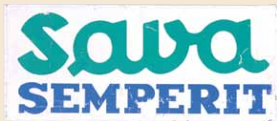
Reklamna tabla Sava Semperit, ki so jo uporabljali v službi za propagando Save na začetku osemdesetih let.

zgodovino, da jih interpretira kot originalna muzejska dokazila, ki bodo v prihodnje označevala današnji prostor in čas.