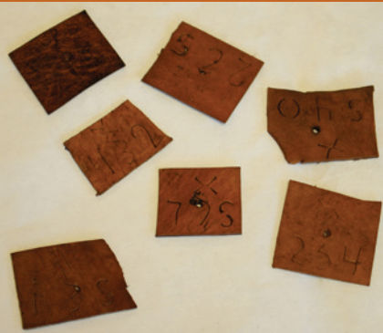
Roši iz Sodjeve usnjarne