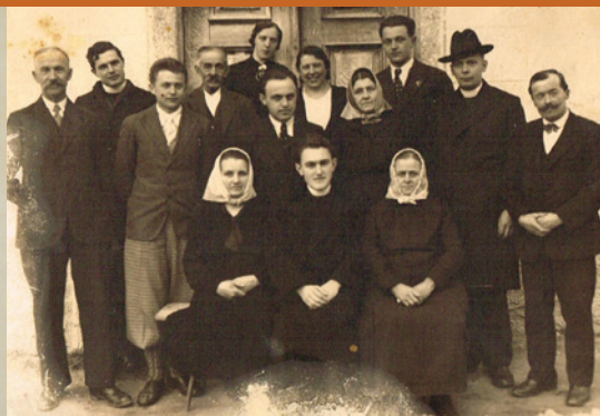
Pred Sodjevo hišo