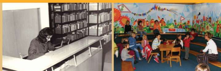
Visoki pulti – knjižnica v domu Zveze Borcev Škofja Loka, med letoma 1954 in 1978