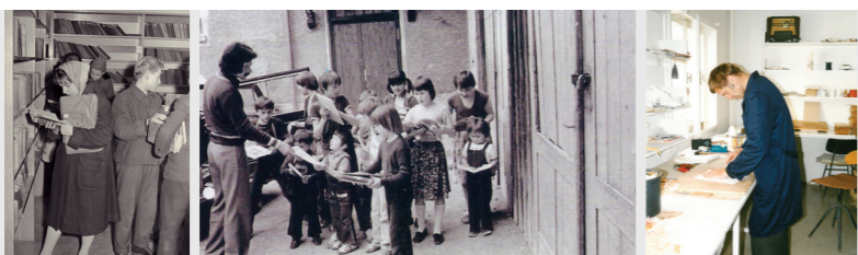
Prosti pristop nekdanjega Splošnega oddelka v Kranju