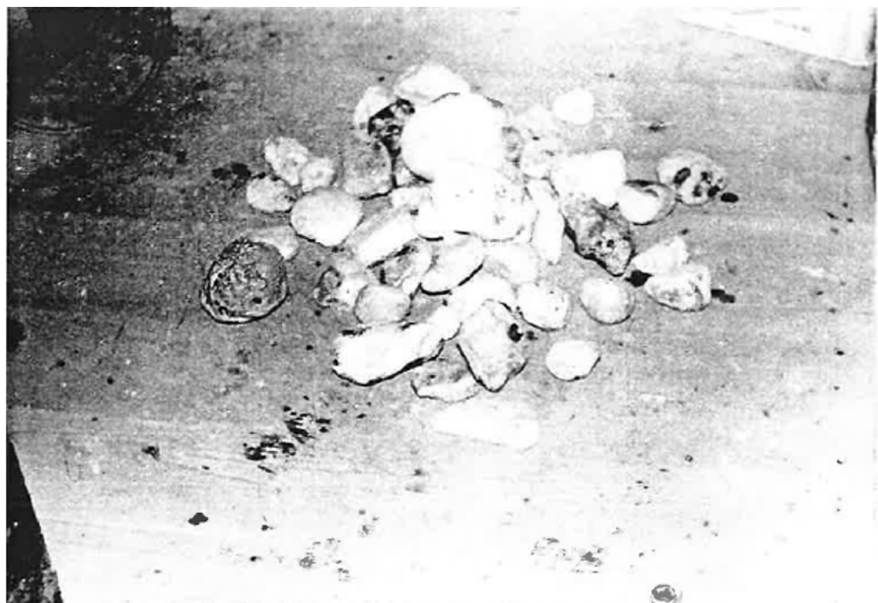
Toliko kamenja je bilo najdeno v prostorih hiše.