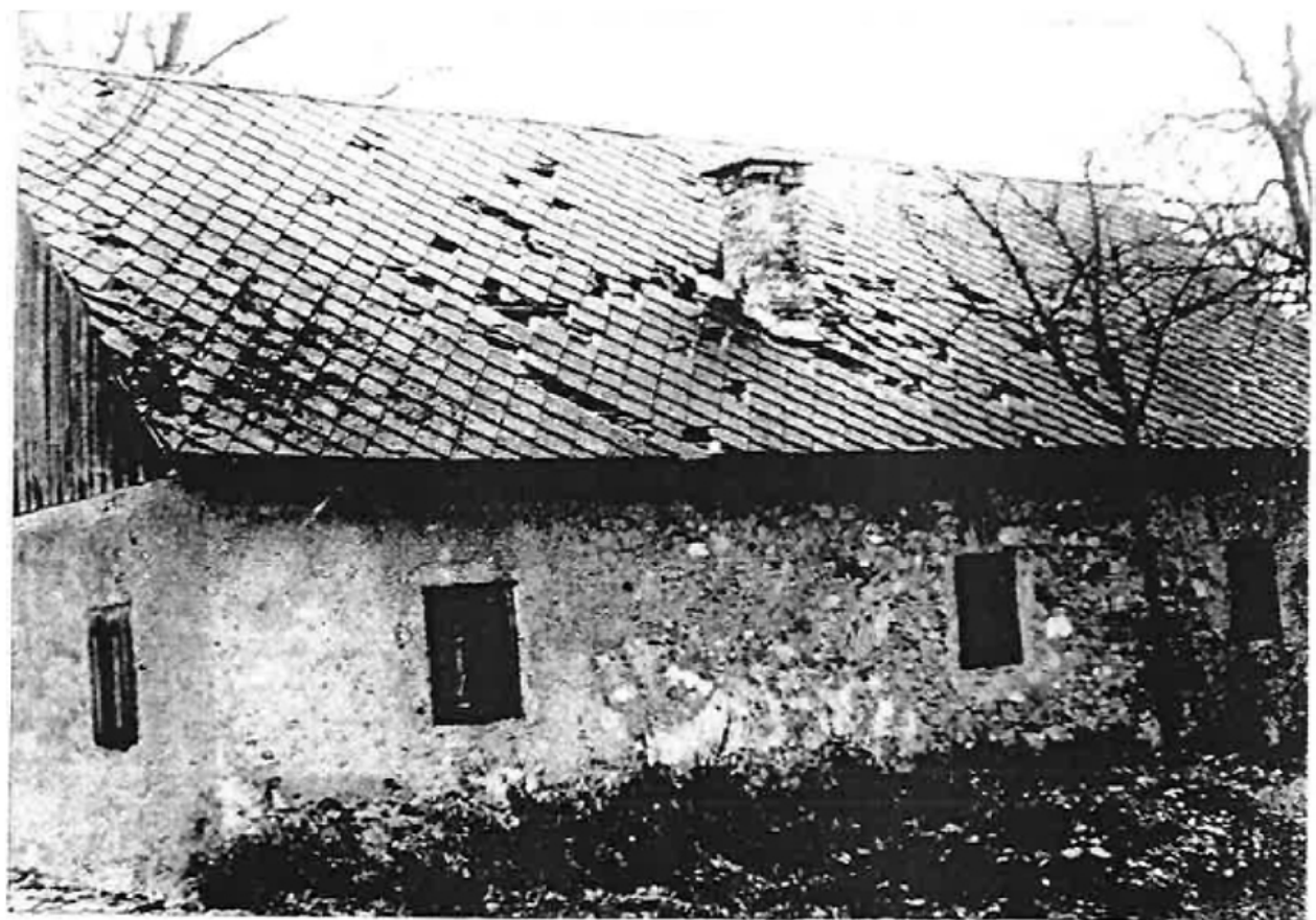
Južna stran stanovanjske hiše. Na strehi se vidi razbita strešna opeka.