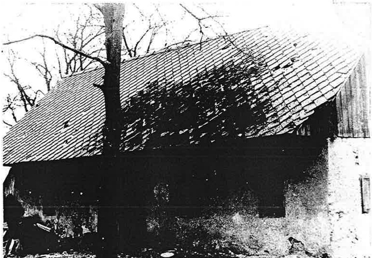
Severna stran stanovanjske hiše. Na fotografiji se vidi kako je bila razbita strešna opeka.