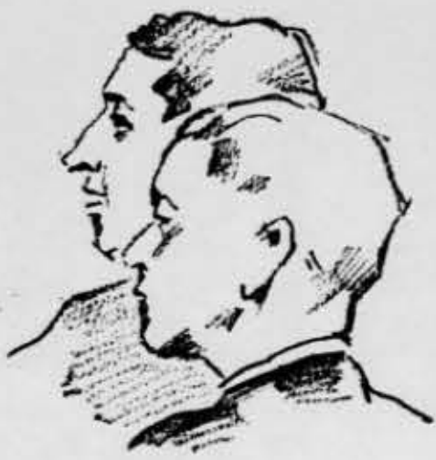
Kos in Gregorin

»Ne, ker je pobegnil v Nemčijo.« »Torej je pobegnil zbog tega, ker je tako grdo govoril proti državi?«